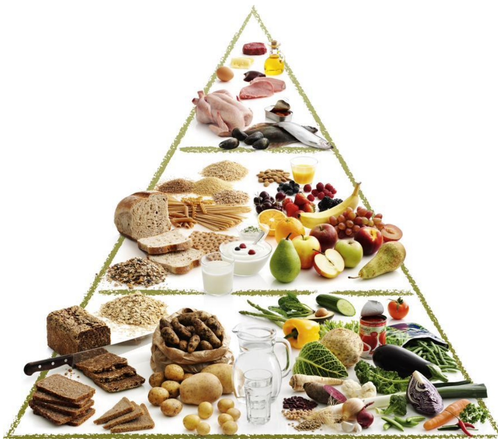
Figur 2: Madpyramiden

I 2011 udviklede FDB en ny udgave af den velkendte madpyramide. FDB's nye madpyramide er vist i figur 2. Heraf fremgår det, at man ideelt set bør spise mest af både groft brød - særligt rugbrød - og grøntsager. Ser man på andelen af disse indsamlede fødevarer hos FødevarerBanken, udgør de samlet set 12 pct. af den totale indsamlede mængde fødevarer. Den nye madpyramides midterste lag udgøres af mejeriprodukter, frugt og lyst brød. Disse typer af fødevarer udgør i 2016 sammenlagt 45 pct. af den totale indsamlede mængde fødevarer hos FødevarerBanken.